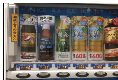
健康に留意した 自販機製品ラインナップ