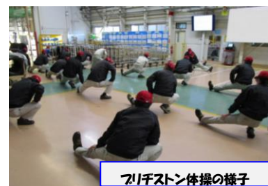
ブリヂストン体操の様子