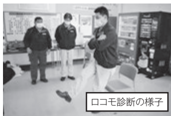
ロコモ診断の様子