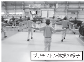
ブリヂストン体操の様子