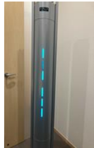
【空気循環式紫外線清浄機】