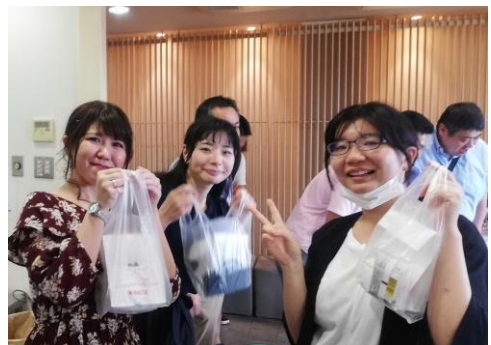
【社員研修旅行にて】