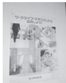
【事務所内掲示ポスター】