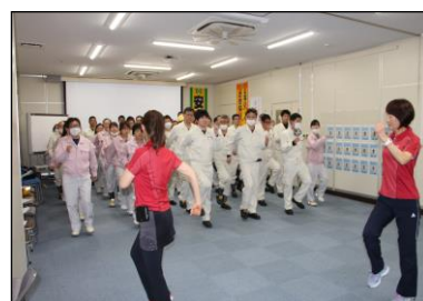
ウォーキングセミナー