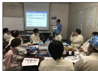
ワイガヤ形式でワークショップ開催