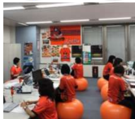
「大宮アルディージャ」のユニフォームを着用し、バランスボールに乗って業務をしている