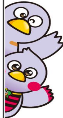
埼玉県のマスコット コバトン&さいたまっち