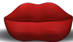
スタジオ 65《マリリン/ポッカ》

館内には一風変わったデザインの椅子を数多く展示しており、見るだけでなく自由にその座り心地を楽しむことができます。どんな椅子が待っているのか、親子で美術館を探検してみてください。