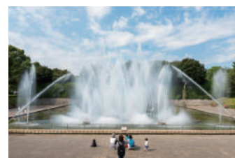
北浦和公園の音楽噴水

美術館がある北浦和公園の音楽噴水では、10時から20時の毎偶数時に、音楽に合わせて水が踊り出します。音楽と水が織りなす迫力のプログラムに、お子様も大興奮間違いなし！