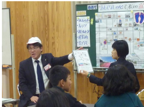
小学校【外国語活動】