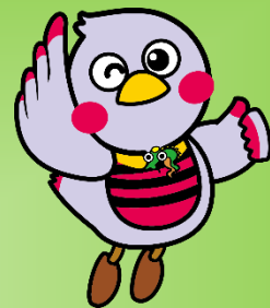
埼玉県マスコット「さいたまっち」