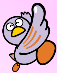
埼玉県マスコット 「コバトン」