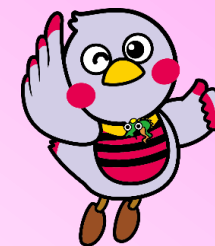
埼玉県マスコット「さいたまっち」