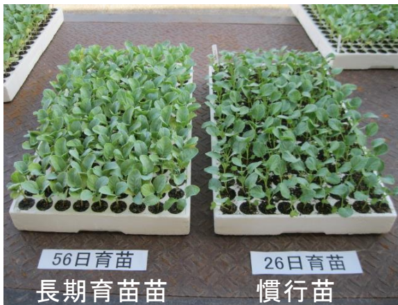
写真1 ブロッコリーの苗 (144穴)

注) 農業支援課資料、農業機械・施設便覧ほか資料を参考に試算、 ○: 播種、△: 定植、×: 収穫