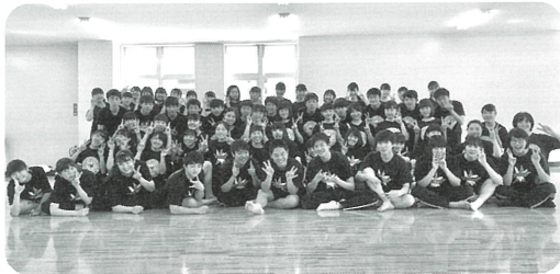
埼玉栄高等学校ダンス部

ペルー、チリ、アルゼンチン育ち。コンドルズ主宰。第4回朝日舞台芸術賞寺山修司賞受賞。第67回芸術選奨文部科学大臣賞受賞。TBS系列『情熱大陸』、NHK総合『地球イチバン』等出演。NHK教育『からだであそぼ』内『こんどうさんちのたいそう』、『あさだからだ』内『こんどうさんとたいそう』、NHK総合『サラリーマンNEO』内『テレビサラリーマン体操』などで振付出演。『AERA』の表紙にもなる。他にも野田秀樹演出NODA・MAP『パイパー』に振付出演。野田秀樹演出、NODA・MAPの四人芝居『THE BEE』で鮮烈役者デビュー。前田哲監督映画『ブタがいた教室』などに役者として出演。NHK連続テレビ小説『てっぺん』オープニング振付、三池崇史監督映画『ヤッターマン』、宮崎あおい主演『星の王子さま』などの振付も担当。女子美術大学、立教大学などで非常勤講師としてダンスの指導もしている。愛犬家。