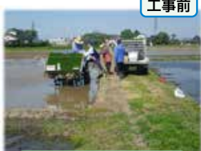
狭く耕作しづらい農地