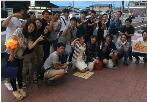
若者たちが地域の回遊性を高める お店紹介マップを作成