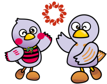
埼玉県のマスコットコバトン・さいたまっち