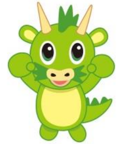
さいたま市 PRキャラクター「ヌウ」