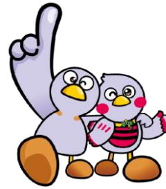
埼玉県マスコット コバトン&さいたまっちゃん