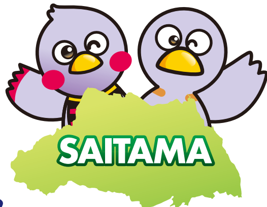
埼玉県マスコット「さいたまっち&コバトン」