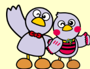
埼玉県のマスコット 「コバトン」「さいたまっち」

※ 交付決定後に就業規則を改正し、上記の取組(就業規則の改正)を実施する場合が対象となります。