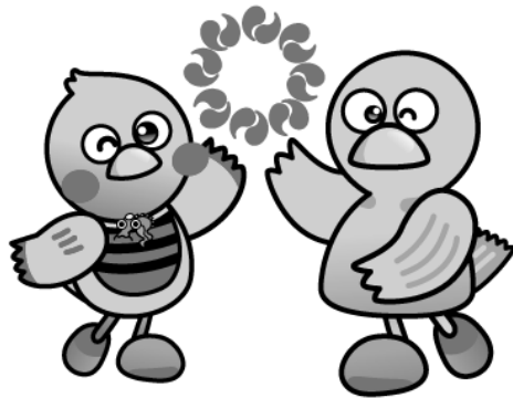
埼玉県のマスコット コバトン&さいたまっち