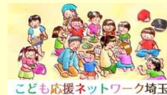
こども応援ネットワーク埼玉

こども応援ネットワーク埼玉事務局 個人や企業が会員となって、 社会貢献活動を促進する仕組