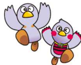
コバトン&さいたまっち