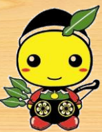
毛呂山町: もろ丸くん