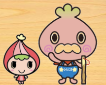
川島町: かわべえ &かわみん