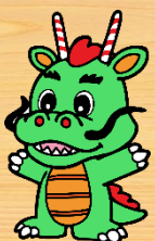
鶴ヶ島市: つるゴン