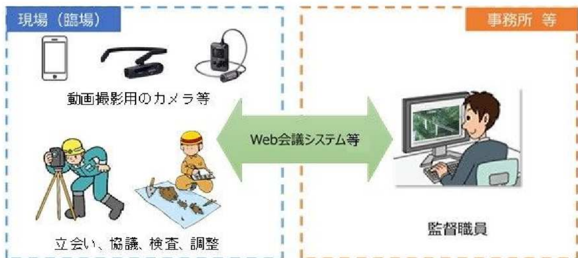
図 3-1 機器構成（例）