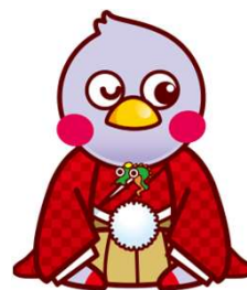
埼玉県マスコット さいたまっち

埼玉県文化振興基金は、皆様の寄附金で成り立っています。 文化振興基金の拡充に御支援、御協力を賜りますようお願いいたします。