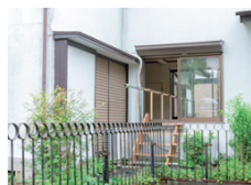
8月に開催された展示「絵の置かれたリビング」では、庭とリビングを大胆に使った建築とアートの世界を表現。

卒業後もここに残りたくて定住を決意。エニエの構想に辿り着いたそう。「鳩山町に来る人は面白い人ばかり。ここを拠点に色々実験したい」と意気込んでいます。