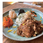
名物の無水カレーは通販でも購入できます。