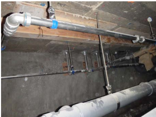
バージン/リサイクル原料から製造したパイプの環境負荷