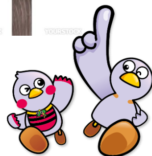
さいたまっち&コバトン