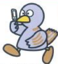
埼玉熊マスコット 【コバタン】

例えば…携帯電話を利用する場所と時間を約束させる。 コミュニティサイトの危険を伝え、安易に利用させない。