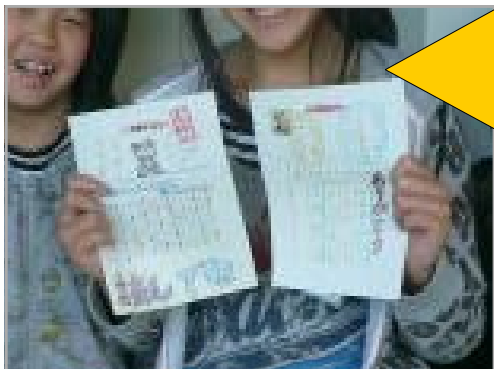
「返事がきました。よろこんでくれてうれしいな。」