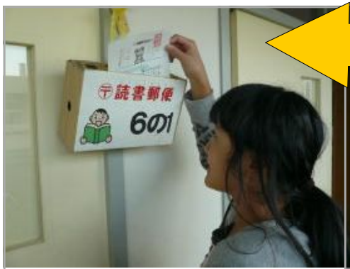
「書いた手紙をポストに入れて、早く返事が来ないかな。」