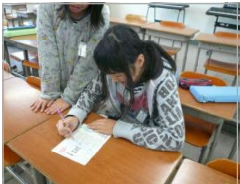
「楽しい本だから1年生の〇〇さんに教えてあげよう。」