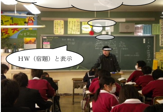
HW (宿題) と表示

毎日提出する家庭学習ノートで確認→チェックは教科担任だけでなく、学年全員の職員が確認 (組織的なチェック体制)、意欲をあげるための学校オリジナル印の使用