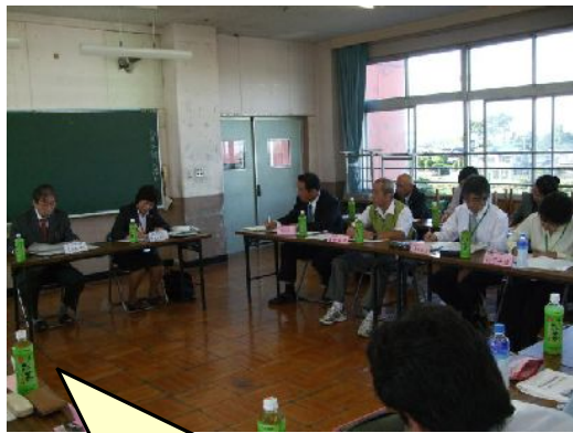
授業研究会は年3回実施。一人一研究授業で研究協議の時間がとれないときにはメモ等で技量を高め合っている。