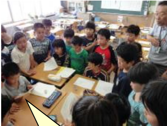
話し合い活動や言葉がけを研究している。(校長も授業)