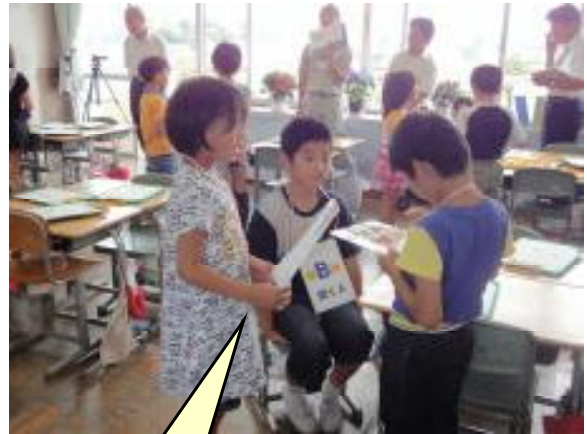
ロールプレイングをしてスキルアップをしている。