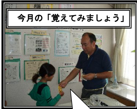
今月の「覚えてみましょう」