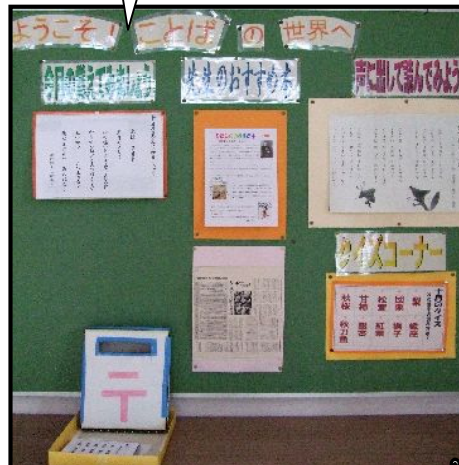
読書指導 (目指せ 50000 冊)