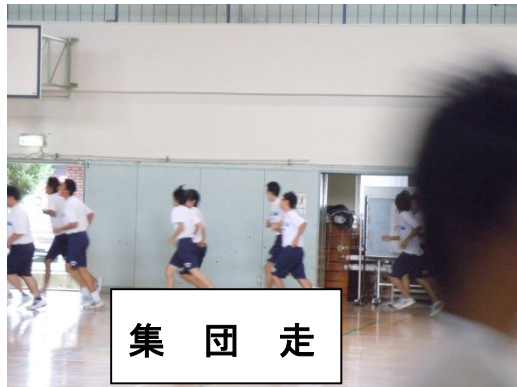
集 団 走

保健体育科の授業は、授業の開始の礼の時間を「5秒間」とり、その後の準備体操の集団走では、元気よく「1・2・3・4・5」のかけ声をかけている。それが「静」から「動」へのけじめとなる。