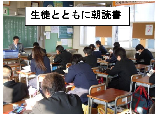
生徒とともに朝読書

清掃と朝読書は、あいさつ・靴そろえとともに、学習ルールの徹底をはかるための基盤（前提）となる。そこで、清掃では「無言清掃」「ひざつき清掃」を推奨し、全校一斉の朝読書は毎日の落ち着いた学校生活の第一歩となる。どちらも豊かな心の育成にもつながっている。