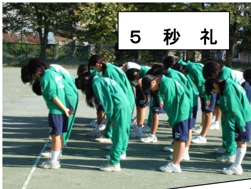
5 秒 礼

清掃と朝読書は、あいさつ・靴そろえとともに、学習ルールの徹底をはかるための基盤（前提）となる。そこで、清掃では「無言清掃」「ひざつき清掃」を推奨し、全校一斉の朝読書は毎日の落ち着いた学校生活の第一歩となる。どちらも豊かな心の育成にもつながっている。