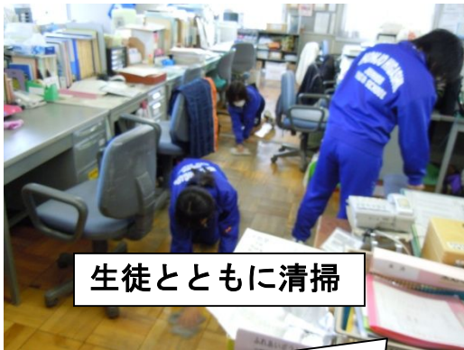
生徒とともに清掃