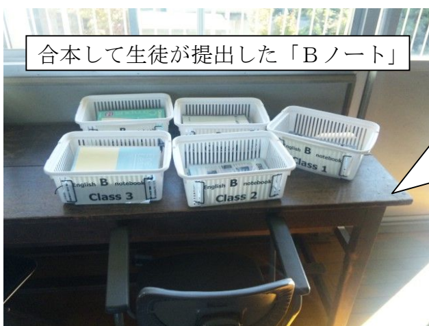
合本して生徒が提出した「Bノート」