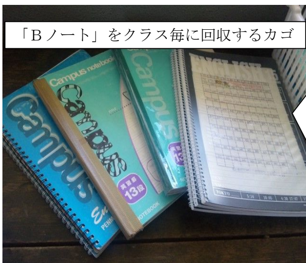
「Bノート」をクラス毎に回収するカゴ