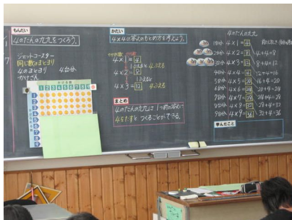
児童の思考に沿った板書