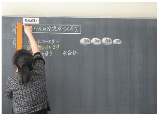
児童も教師も定規を使って