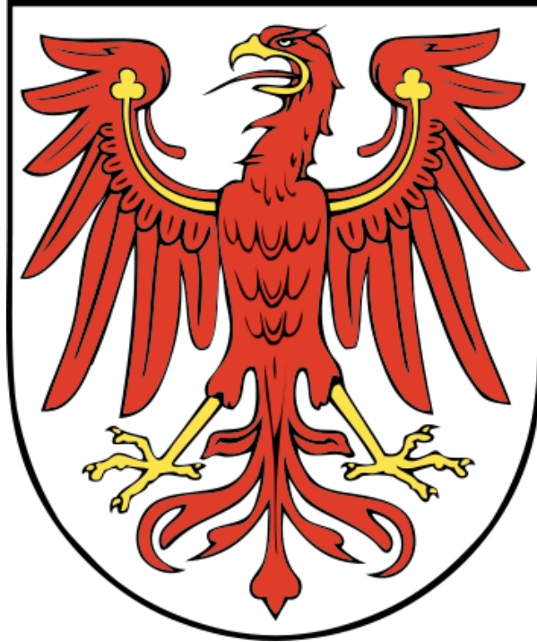
ブランデンブルグ州の州章