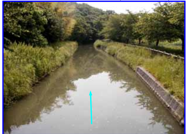
さいたま市緑区南部領土地先