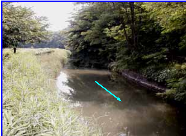
さいたま市緑区南部領土地先