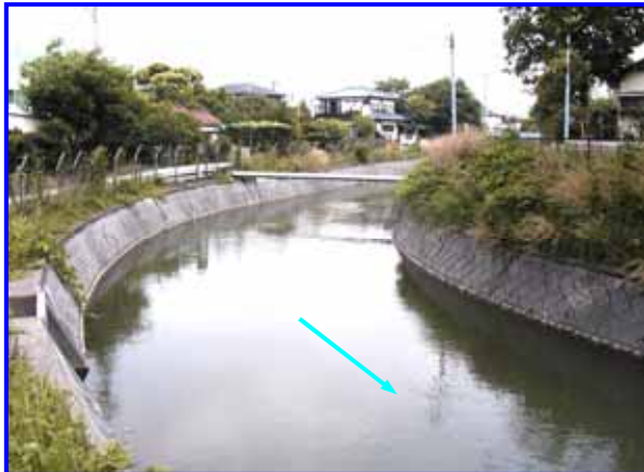
さいたま市見沼区東宮下地先