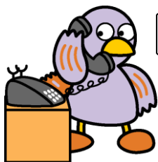
埼玉県マスコット「コパトン」