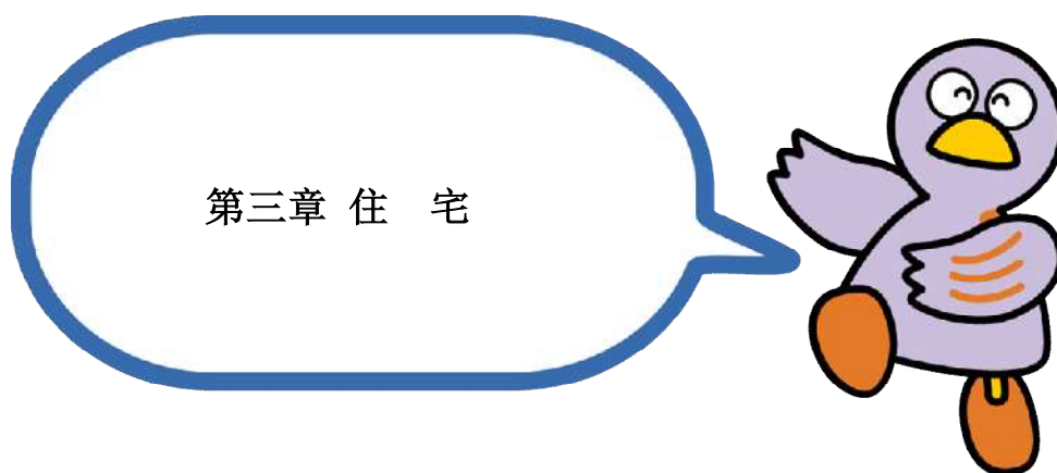
埼玉县的吉祥物-小紫鸽