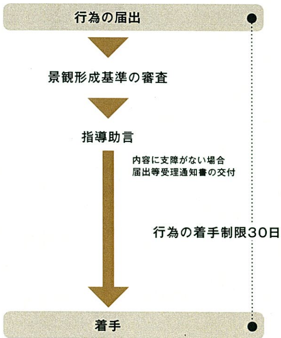
事前指導制度を活用しない場合