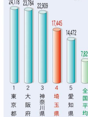
24時間平均交通量 (上位5位)