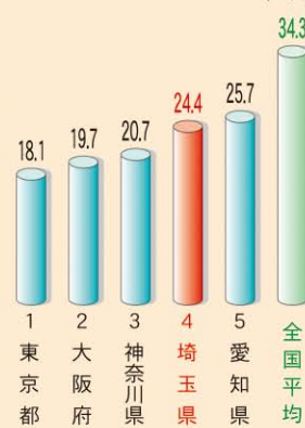
混雑時走行速度 (下位5位)