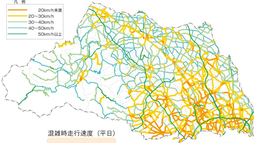
混雑時走行速度（平日）