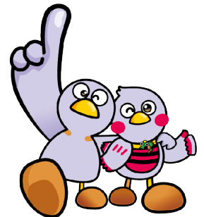
埼玉県のマスコット コバトン&さいたまっち