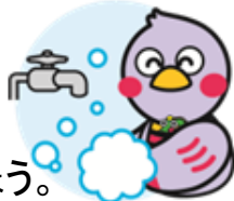
埼玉県マスコット 「さいたまっち」