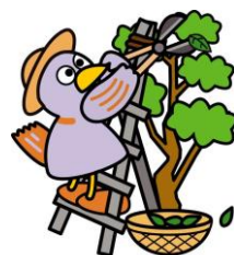
埼玉県マスコット コバトン