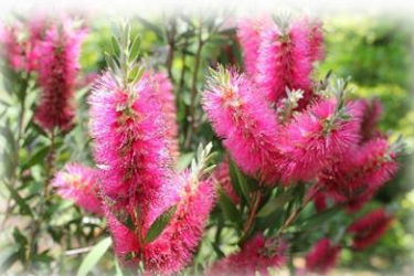
カリステモン (ブラシノキ)