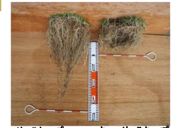
キョーリョクキープ underあり キョーリョクキープ underなし