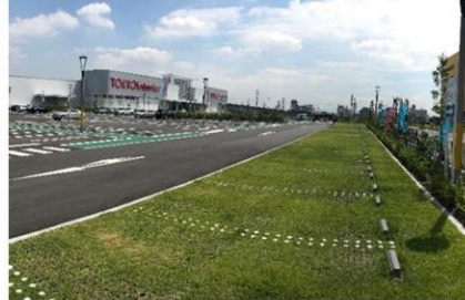
大型商業施設 (大阪府)