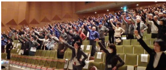
会場全員による川の国埼玉宣言

③【荒川の再生事業と川の国応援団、埼玉県連の連携】国土交通省荒川上流河川事務所及び荒川の自然を守る会