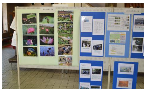
ロビーでのパネル展示(一部)

参加者からは、「川の意義、必要性を再認識しました」「流域単位で身近な方々の活動が理解できました」などのご感想をいただきました。ご参加いただいた皆様、ありがとうございました！